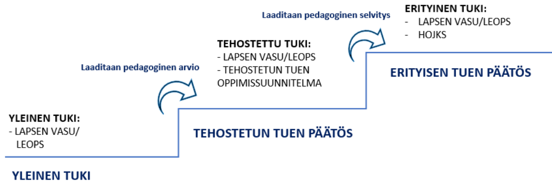
Kuvio: Tuen portaat esiopetuksessa

tukeen siirtämisestä tekee kirjallisen päätöksen 11-vuotisen oppivelvollisuuden osalta johtava rehtori erityisopettajan pedagogisen selvityksen (tms.) pohjalta. Muut erityisen tuen siirrot tekee varhaiskasvatusjohtaja erityisopettajan pedagogisen selvityksen tms. pohjalta. Erityisestä tuesta laaditaan HOJKS eli henkilökohtainen opetuksen järjestämistä koskeva suunnitelma.