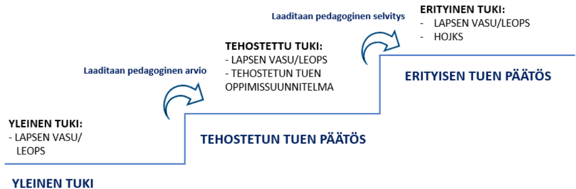
Kuvio: Tuen portaat esiopetuksessa

Esiopetukseen osallistuvat lapset kuuluvat perusopetuslain mukaisen kasvun ja oppimisen tuen piiriin. Lapsen kasvun ja oppimisen tuen kolme tasoa ovat yleinen, tehostettu ja erityinen tuki. Jokainen esiopetukseen osallistuva lapsi on yleisen tuen piirissä. Mikäli yleisen tuen tukimuodot eivät ole riittäviä, lapsen esiopettaja tekee pedagogisen arvion lisätuen tarpeen selvittämiseksi. Arvion pohjalta lapsi siirretään tarvittaessa tehostettuun tukeen. Tehostetun tuen tarve kirjataan tehostetun tuen oppimissuunnitelmaan. Mikäli tehostettu tuki ei riitä, tehdään lapsesta pedagoginen selvitys. Tämän selvityksen pohjalta lapsi voidaan siirtää erityiseen tukeen. Erityiseen tukeen siirtämisestä tekee kirjallisen päätöksen 11-vuotisen oppivelvollisuuden osalta johtava rehtori erityisopettajan pedagogisen selvityksen (tms.) pohjalta. Muut erityisen tuen siirrot tekee varhaiskasvatusjohtaja erityisopettajan pedagogisen selvityksen tms. pohjalta. Erityisestä tuesta laaditaan HOJKS eli henkilökohtainen opetuksen järjestämistä koskeva suunnitelma.