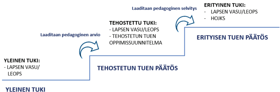
Kuvio: Tuen portaat esiopetuksessa

Esiopetukseen osallistuvat lapset kuuluvat perusopetuslain mukaisen kasvun ja oppimisen tuen piiriin. Lapsen kasvun ja oppimisen tuen kolme tasoa ovat yleinen, tehostettu ja erityinen tuki. Jokainen esiopetukseen osallistuva lapsi on yleisen tuen piirissä. Mikäli yleisen tuen tukimuodot eivät ole riittäviä, lapsen esiopettaja tekee pedagogisen arvion lisätuen tarpeen selvittämiseksi. Arvion pohjalta lapsi siirretään tarvittaessa tehostettuun tukeen. Tehostetun tuen tarve kirjataan tehostetun tuen oppimissuunnitelmaan. Mikäli tehostettu tuki ei riitä, tehdään lapsesta pedagoginen selvitys. Tämän selvityksen pohjalta lapsi voidaan siirtää erityiseen tukeen. Erityiseen tukeen siirtämisestä tekee kirjallisen päätöksen 11-vuotisen oppivelvollisuuden osalta johtava rehtori erityisopettajan pedagogisen selvityksen (tms.) pohjalta. Muut erityisen tuen siirrot tekee varhaiskasvatusjohtaja erityisopettajan pedagogisen selvityksen tms. pohjalta. Erityisestä tuesta laaditaan HOJKS eli henkilökohtainen opetuksen järjestämistä koskeva suunnitelma.